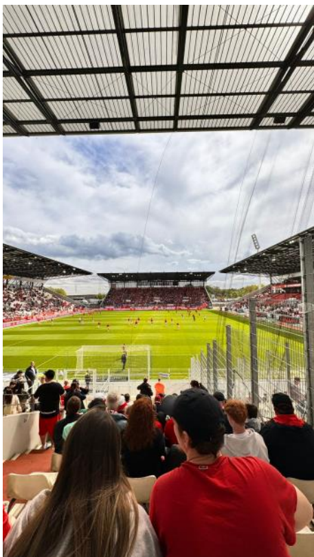
„Rot-Weiß Essen, wir lieben Dich!“, so die Fangesänge. Die Besucher aus Dortmund ließen sich mitreißen, stimmten ein und unterstützten die Gastgeber.

stellung zum Thema „Fußball“ stattfindet. Hier konnten die Jugendlichen einiges über die Geschichte ihres Lieblingssports in Deutschland erfahren.