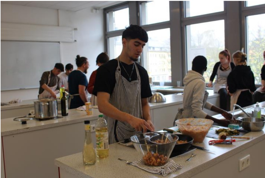
Kochen für das spätere Fastenbrechen .Jeweils eine Gruppe übernahm die Zubereitung für alle.

schen Sprache in Kontakt zu bleiben. 4 Betreuer in zwei Gruppen stellten das diesmal sicher, erweiterten zum Thema „Gesundheit“ den Wortschatz der Jugendlichen, führten Übungen zur Grammatik und zum Satzbau durch und organisierten Nachmittagsaktivitäten, die zum Mitmachen und Lernen motivierten.