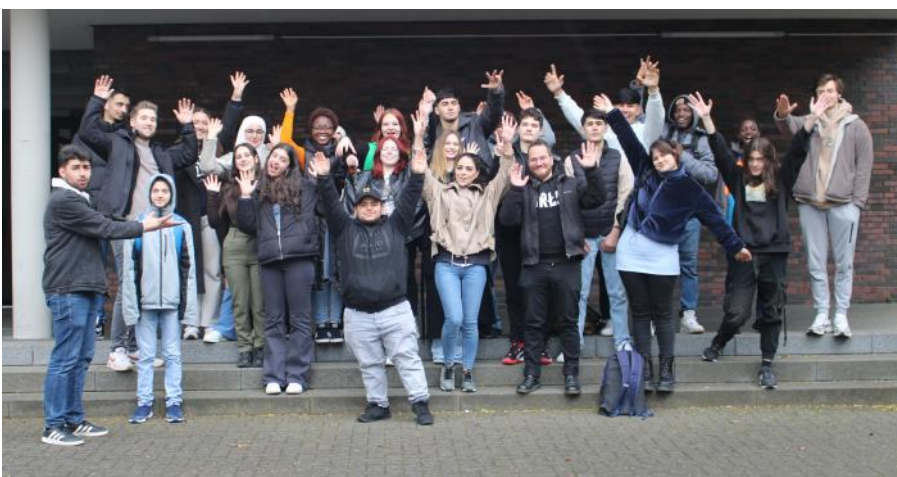
Teilnehmer:innen der Oster-Lernferien mit den Betreuer:innen von Adam's Corner.

Zum Abschluss der Lernferien stand für die Schüler:innen dann die Stadtrallye auf dem Programm. Auf der Suche nach Antworten (Wo befinden sich Krankenhäuser in Dortmund und wie heißen sie? Wie viele Medikamente sind in einer Apotheke erhältlich und was kostet das teuerste Präparat?) streiften die Jugendlichen durch die Stadt, lernten so ihre Umgebung näher kennen und erweiterten ihr Wissen zum Thema „Gesundheit“.