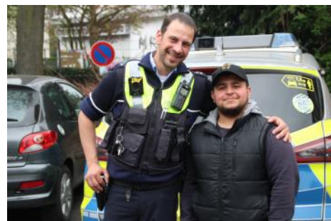
Die Freunde und Helfer von der Polizei waren da: Sie gaben Tipps zum gesundheitsfördernden Verhalten im Straßenverkehr.