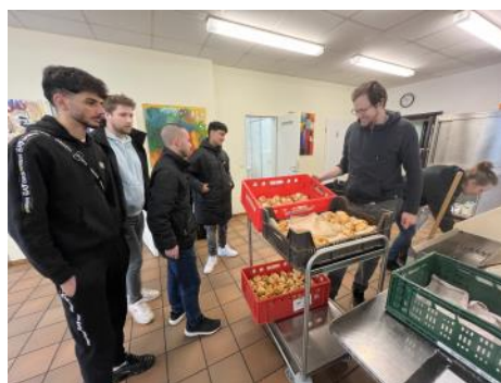
Übergabe der Pizzabrötchen an die Kana-Suppenküche.

Für ihre Kochaktion entschieden sich die Jugendlichen, Pizzabrötchen zuzubereiten. Gefüllt wurden diese mit Käse, Pesto und Gemüse. Auf diese Weise produzierten die Schüler:innen 350 Brötchen, die anschließend vom Projektleiter