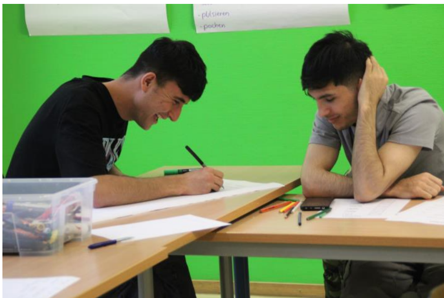
Die Teilnehmer:innen beim Lernen neuer Vokabeln zum Thema „Gesundheit“.

griffen im Internet die Telefonnummern zu finden sind. Bei je-