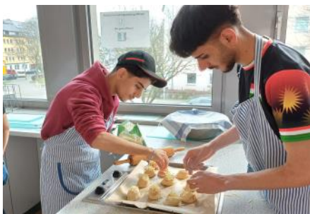
Weil das Auge mitisst: Styling für jedes Brötchen.

Inmitten der kulturellen Vielfalt und sozialen Herausforderungen Deutschlands entsteht oft ein besonderer Zusammenhalt, der sich in Gemeinschaftsaktionen und gegenseitiger Unterstützung zeigt.