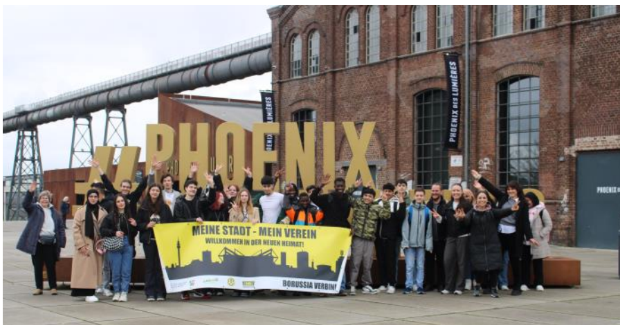
Die Gruppe bei ihrem Besuch im Museum auf Phoenix.

dem Wortfeld „Körper“, ein Erste-Hilfe-Workshop und eine Stadtrallye zum Thema „Gesundheit“. Es waren die achtzehnten Fit-in-Deutsch-Lernferien, die bei Adam's Corner am Westpark stattfanden - vom Land NRW finanziert und in Kooperation mit der VHS Dortmund organisiert und durchgeführt. Die Lernferien ermöglichen zugewanderten Schüler:innen, auch in der unterrichtsfreien Zeit mit der deut-