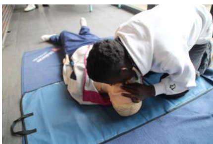
Auch Notfälle wurden bei den Lernferien geübt.

Jemand, der in Deutschland aufgewachsen ist, kennt seine Optionen von Apotheken mit Notdienst über ärztlichen Notdienst bis hin zur Notaufnahme des Krankenhauses und weiß auch, wo und unter welchen Suchbe-