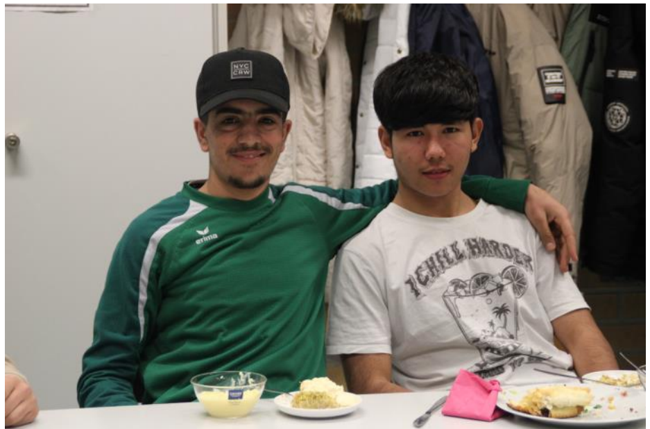
Auch in diesem Jahr war das gemeinsame Fastenbrechen am Abend eine besondere Veranstaltung.

Dazu gehörte u.a. der Besuch der Ausstellung „Phoenix des Lumières“, die das Eintauchen in die Werke von Dalí, Gaudí und Nohlab, eines Istanbuler Design- und Technologiestudios ermöglichen. Außerdem hatten die